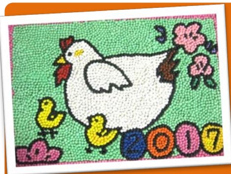
2017年の干支は「酉」 (利用者様作成の壁画。)