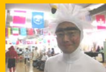
真面目にやっています!