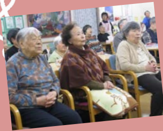
森の泉に～♪ブルーシャトゥ