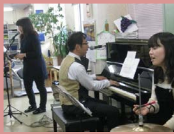
ピアノも弾ける素敵な先生