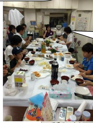
手作りの食事をみんなで一緒に食べるって楽しい!