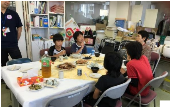
ココロンくらぶで出会って、みんな仲良しになったよ。