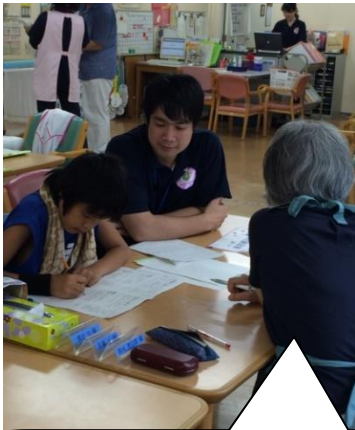
夏休みの宿題が終わっていない〜! マンツーマンで指導して、かなり進んだ様子。

23日のランチ会には、3組6人の兄弟(小・中学生)が参加。スタッフ含め22名の参加がありました。30分かけて自転車でココロンくらぶに来てくれた兄弟もいました。この6人がみんなでボードゲームをしたり、中にはとなりのデイケアに出向き、利用者さんと触れあうシーンもありました。ボランティアさんもますます元気もりもりで、「孫に、“おばあちゃん最近いきいきしてるね”って言われたのよ〜」と誇らしげにおっしゃっていたのが印象的でした。