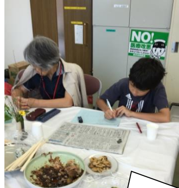
新聞記事から書き取りをしています。別の部屋で勉強するよりもみんながいる場所がいいみたい