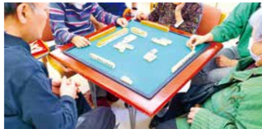
面子が揃えば麻雀大会