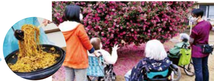
できたての焼きそばを食べました