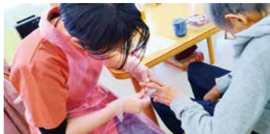
衛生・健康状態のチェック